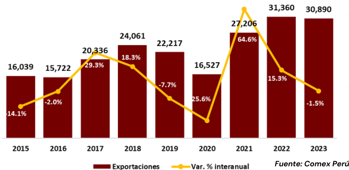
EVOLUCIÓN DE LAS EXPORTACIONES PERUANAS, PRIMER SEMESTRE 2023. (Millones de dólares)

En específico, en el sector tradicional, la contracción se les atribuye a los desempeños negativos del sector petróleo y derivados (-37.7%) debido a los menores envíos de gas natural licuado, del sector pesquero (-28.5%) y agrícola (-56.0%) producto de los distintos fenómenos ocurridos en lo que va del año.