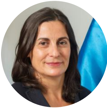
ANA DE MENDOZA